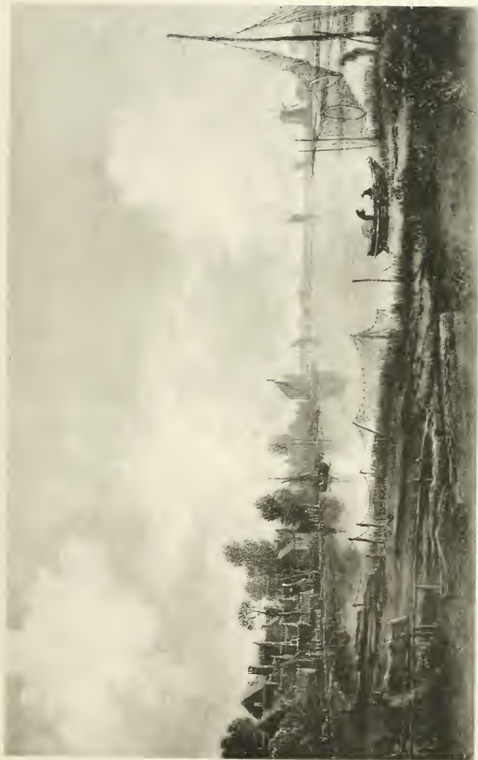
A. VAN DER NEER

TERCENTENAIRE DE REMBRANDT -- EXPOSITION FREDERIK MULLER & CIE.